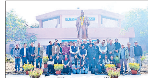
एमडीयू में बाबा साहेब डॉ. भीमराव अंबेडकर को श्रद्धांजलि देते शिक्षक व विद्यार्थी।