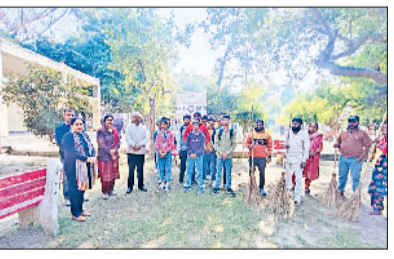
गौड ब्राह्मण कॉलेज में बाबा साहेब को दी श्रद्धांजलि