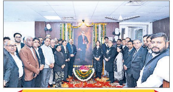
जिला बार एसोसिएशन ने बाबा साहेब को किया नमन