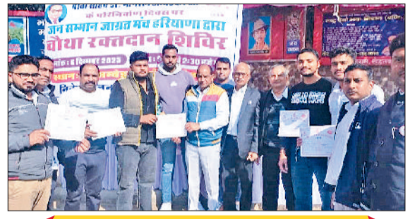
अंबेडकर चौक रोहताक पर लगाया रक्तदान शिविर