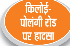
किलोई-पोलंगी रोड पर हादसा

हरिभूमि न्यूज ॥ रोहतक जिले में शनिवार सुबह एक हृदय विदारक सड़क हादसा हुआ। जिसमें बाइक पर जा रहे पिता-पुत्री की मौके पर ही मौत हो गई। यह हादसा रोहतक के किलोई-पोलंगी रोड पर हुआ, जहां पीछे से आ रहे तेज रफ्तार ट्रक (हाइवा) ने बाइक को जोरदार टक्कर मार दी। टक्कर इतनी भयंकर थी कि बाइक ट्रक के नीचे घुस गई और भारी वाहन