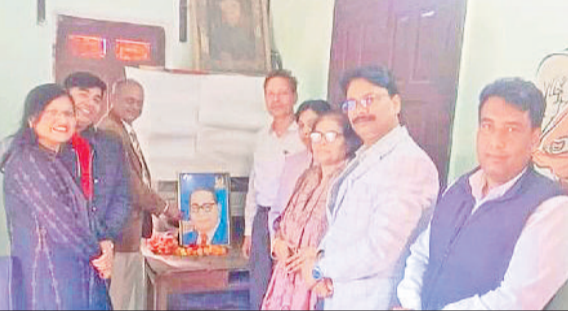
वैद्य महाविद्यालय में बाबा साहेब अंबेडकर की पुण्यतिथि मनाते शिक्षक।